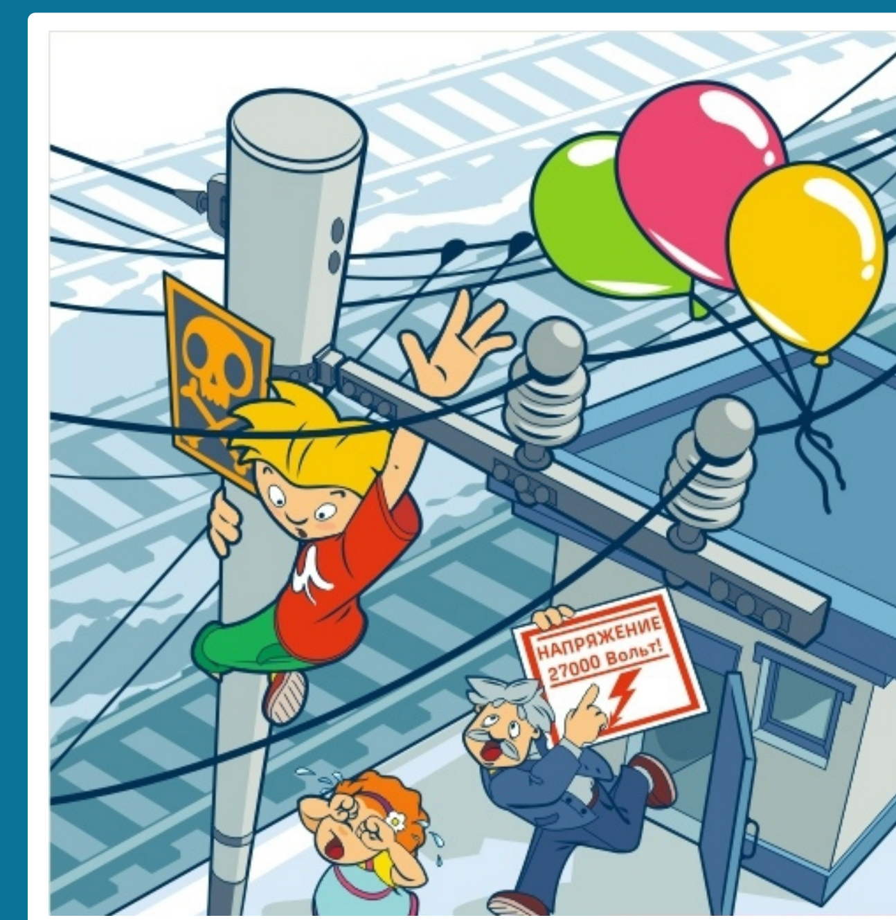
Приблизиться к проводам меньше чем на 2 метра – смертельно опасно!