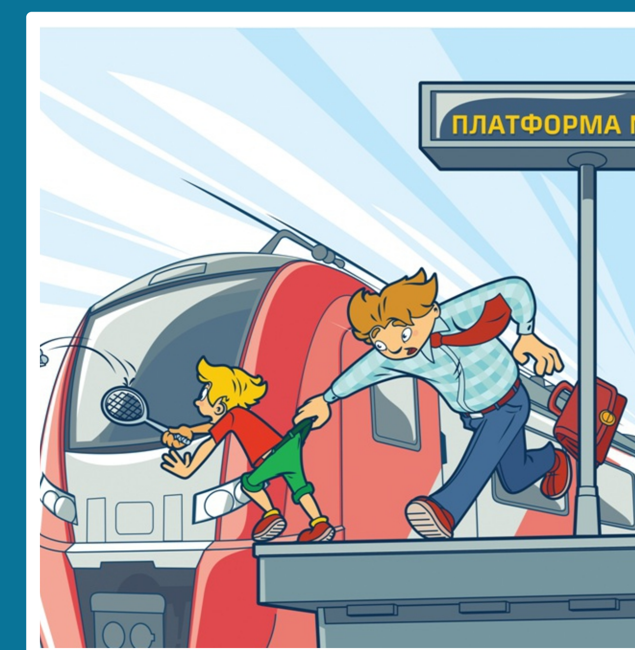
Платформа – не место для игр!